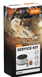
KIT DE SERVICIO