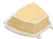
FILTROS DE AIRE