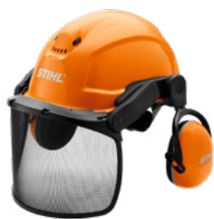
CASCO CON PROTECCIÓN VISUAL Y AUDITIVA

Protección contra impactos en cráneo y rostro.