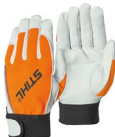
GUANTES DE TRABAJO

Protección contra impactos en cráneo y rostro.